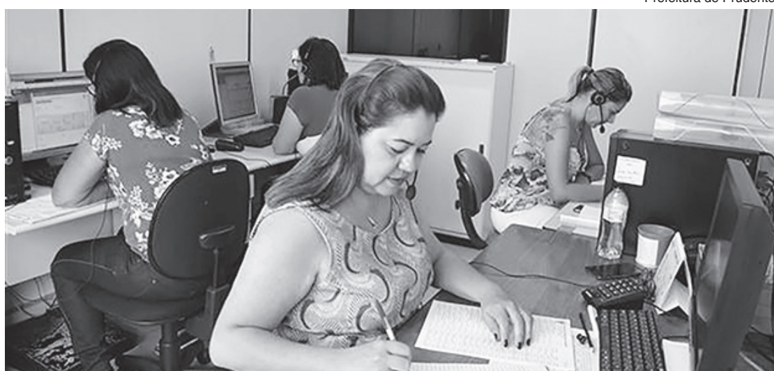
Prefeitura de Prudente

Cada uma das funcionárias deve realizar algo em torno de 20 contatos por dia